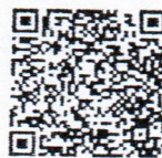
เอกสารประชาสัมพันธ์

ผู้อำนวยการสำนักบริหารการศึกษ 23 มี.ค. 2569